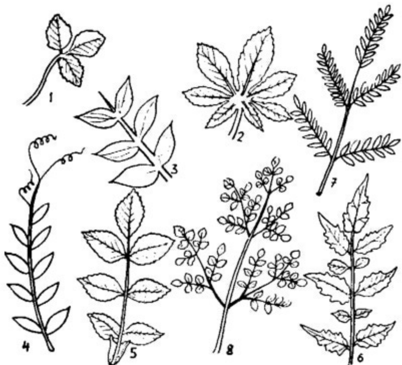
Sl. 308. Složeno građeni listovi: 1 — tročlan; 2 — prstasto složen; 3 — parno perasto složen; 4 — parno perast list sa listićima pretvorenim u raščijke; 5 — neparno perasto složen; 6 — isprekidano perasto složen; 7 — dvojno perasto složen; 8 — trojno perasto složen